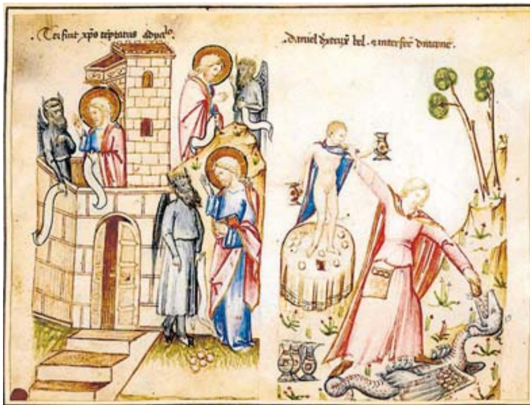
Imatge del llibre Speculum Humanae Salvationis , datat entre el 1309 i el 1324. Actualment és al Museu Fitzwilliam.

LA MALA REPUTACIÓ BELOLID PROA 142 PÀG./16 €