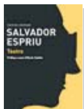
Teatre SALVADOR ESPRIU Labutxaca

Carlins, lligaires, anarquistes, el sometent, la Guàrdia Civil, jornaleros, minyones, capellans i agitadors de tota mena omplen les pàgines de Malanyet , primera obra de ficció de Pere Audí (Tortosa, 1956). El títol del llibre és el nom d'una barriada popular de Falset, envoltada pels petits pobles de la comarca del Priorat –els Guiamets, el Masroig, el Molar, Bellmunt...–, l'escenari principal dels relats, evocats des del principi del segle XX.