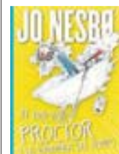
El doctor Proctor i la... JO NESBO La Galera

“Com a base de la seva obra dramàtica, Espriu es va servir de la mitologia, bíblica i clàssica, per exposar-hi els seus interessos temàtics, actualitzar-los i lligar-los al [...] món de «ninots i titelles i de gent de Sinera»”, escriuen Gabriella Gavagnin i Víctor Martínez-Gil al volum que recull tota la producció dramàtica de l'escriptor, que inclou Antígona (text del 1939, revisat el 1967), Primera història d'Esther (1948) i Una altra Fedra, si us plau (1977).