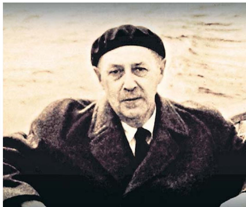
L'última trobada, de Sándor Marai, es va emportar el primer premi Llibreter: entre els finalistes hi havia Vila-Matas i Carme Riera.