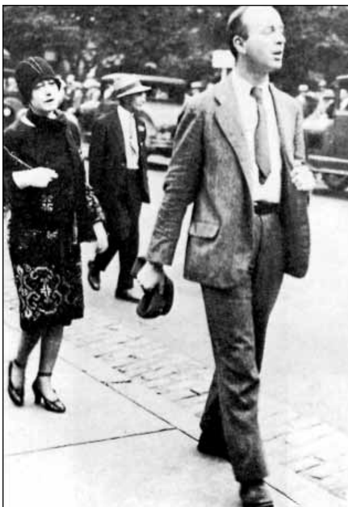
Parker i John Dos Passos en una manifestació el 1927