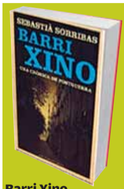
Barri Xino Una crònica de postguerra

Mosaic d'un espai molt concret Sorribas -nascut al Barri Xino l'any 1928- ens ofereix un ampli i variat mosaic centrat en un espai molt concret -el quadrat que formen el carrer Nou, la Rambla, el Portal de Santa Madrona i el Paral·lel- i en