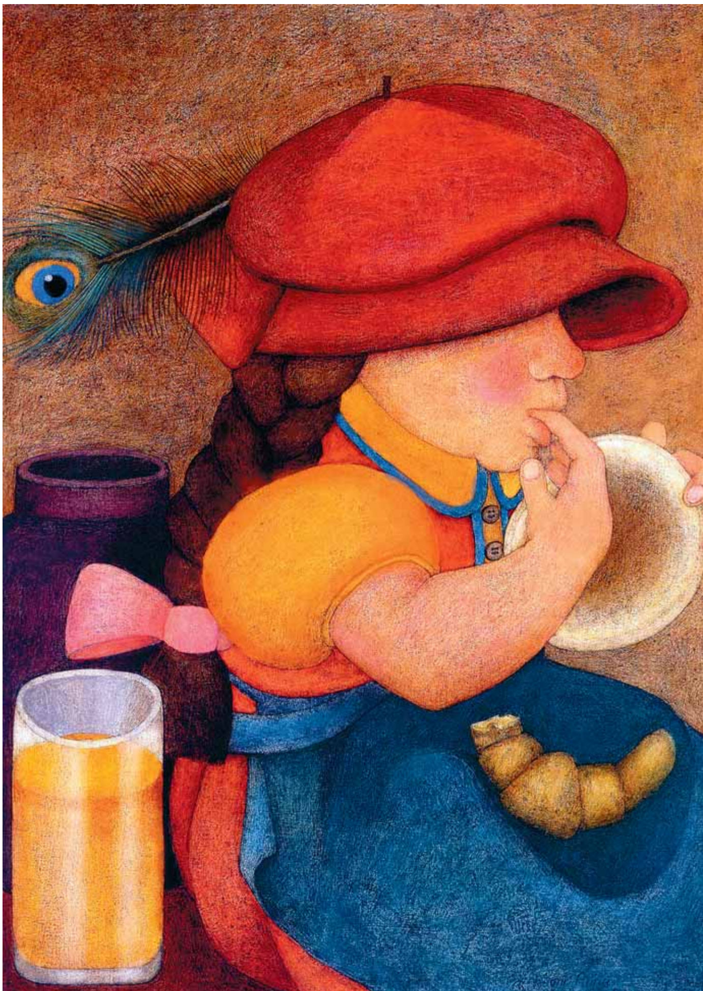
ETIENNE DELESSERT / COMBEL - CASALS

Literatura infantil i juvenil Text: Andreu Sotorra