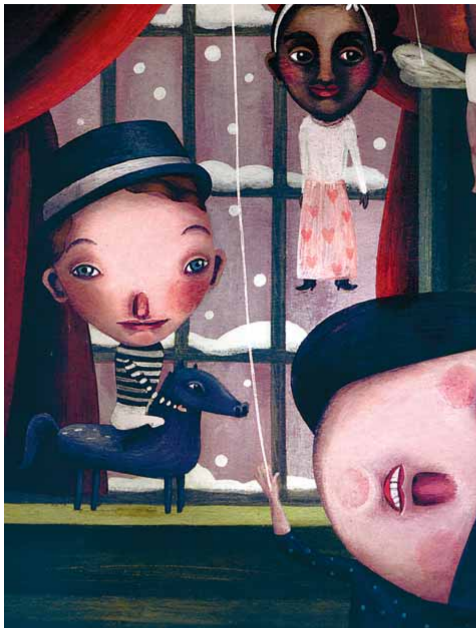
REBECA LUCIANI / EDITORIAL BAULA