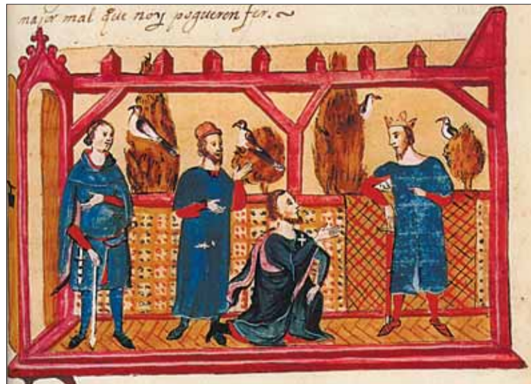
Il·lustració sobre el rei Jaume I d'un manuscrit del Llibre dels Fets .