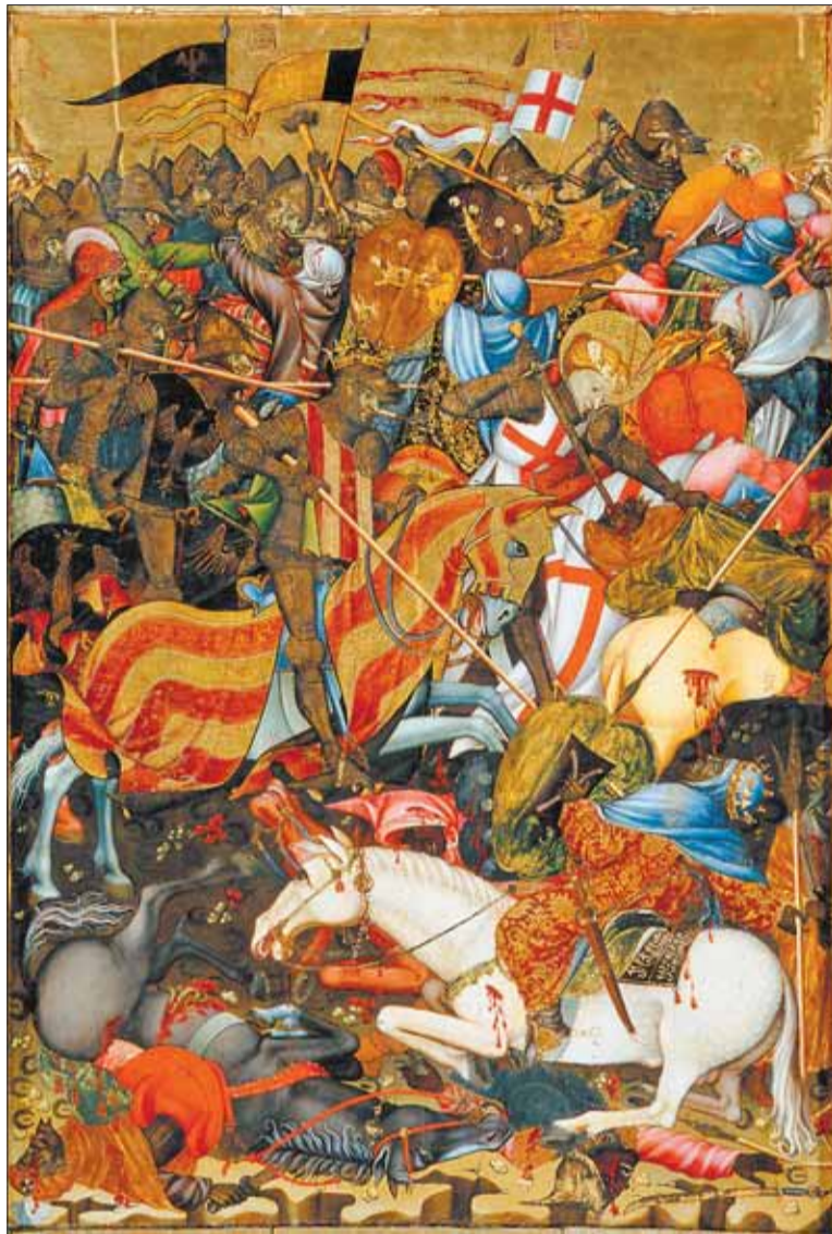
Retaule sobre la Batalla del Puig, on es decidí la sort final de la ciutat de València.

També se li ha retret que atengués la petició d'ajut del seu nebot, el rei de Castella, Alfons X, davant la revolta del regne musulmà de Múrcia, que n'era vassall des de 1243. Tot i l'oposició interna, Jaume, que devia témer que una Múrcia en armes pogués desestabilitzar la nombrosa població musulmana que seguia vivint al regne de València, va conquerir Múrcia i, després de repoblar-la en part amb catalans, va cedir-ne