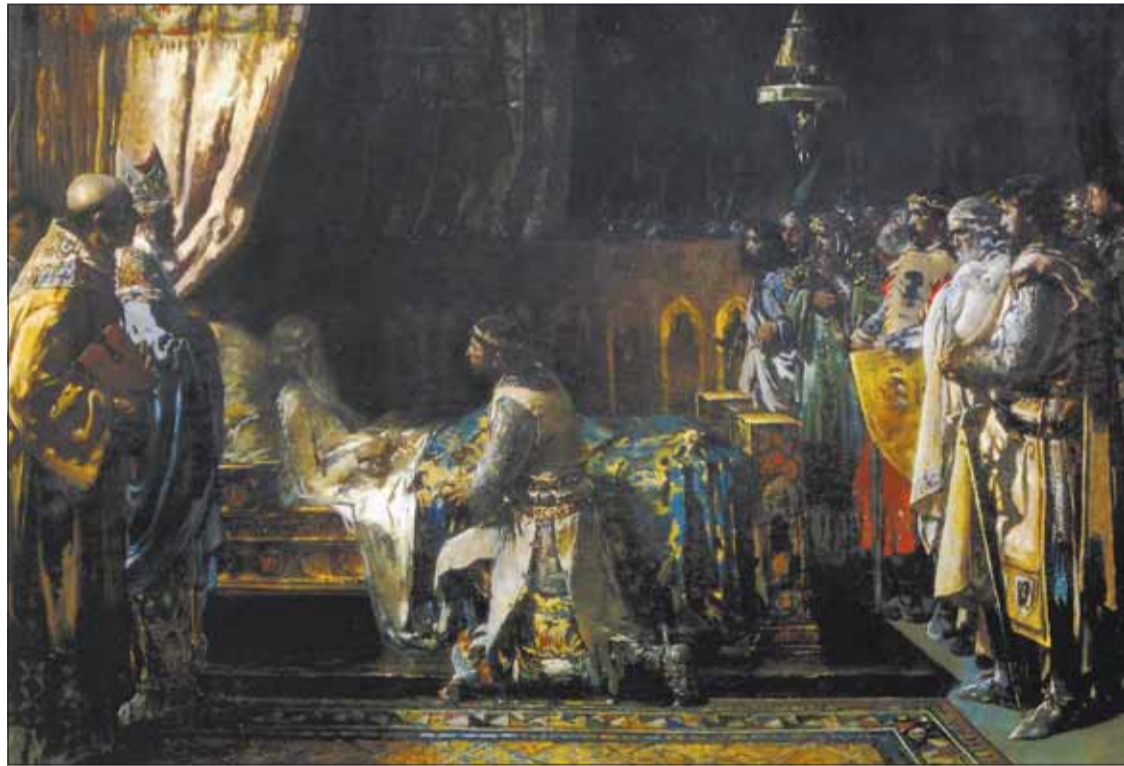
La pintura d'Ignasi Pinazo Els últims dies de Jaume I , que representa el Rei moribund i, agenollat, el seu fill Pere el Gran.