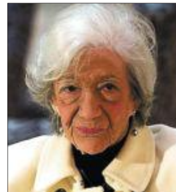
Ana María Matute.

Antologia de vuit contes escollits entre la seixantena que ha escrit Martínez de Pisón, per celebrar el 25è aniversari del seu debut com a escriptor. Els relats tenen en comú els conflictes de família, de parella, de la vida quotidiana. La relació matrimonial o la vinculació entre un pare i la seva filla són alguns dels arguments.