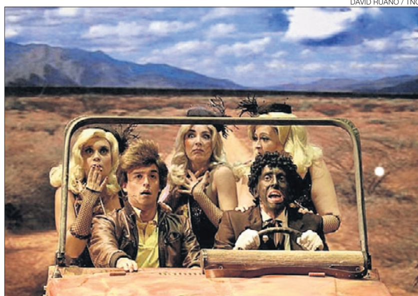
► Un moment del musical per a tots els públics La casa sota la sorra .