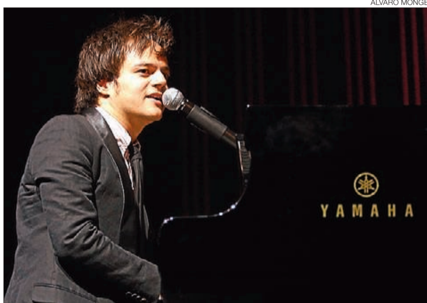
▶ Jamie Cullum, durant la seva actuació al Sant Jordi Club.

En el desangelat Sant Jordi Club, el músic britànic va parlar poc i no va poder cantar sense micròfon ni baixar a passejar-se per la platea com sol fer. El volum de l'èxit és inversament proporcional a la intimitat, i Cullum ja no pot jugar la carta de l'artista pròxim. Però n'hi queden moltes altres: en l'arrencada es va saltar el guió i va cridar el públic de les últimes files a ocupar l'espai davant de l'escenari, cosa que va alegrar aquells que per fi el podien veure decentment però que va dis-