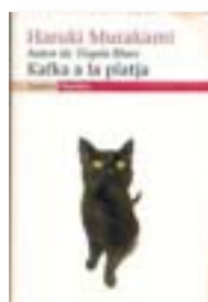
Encetat el nou mil·lenni, el nou repte va ser Kafka a la platja. L'any 2010 va constar en el top dels més venuts del New York Times. Murakami va consolidar el seu èxit amb la història d'un jove que fugia de casa els pares per no caure en els paranys d'Èdip.

Tot i que Murakami va començar a escriure a finals dels anys 70, la seva fama internacional es va fer esperar fins al 1986, quan va publicar