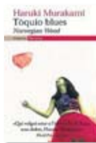
Tòquio blues. Fa un any va ser traslladada al cinema per Anh Hung Tan. A La Butxaca, en català.

Fa ben bé 25 anys que Haruki Murakami és al top de vendes de tot el món. Va arribar a la fama el 1986,