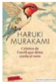
De totes les novel·les que Murakami va signar abans d'IQ84, La crònica de l'ocell que dona corda al món és la més celebrada. No havia tingut una traducció en català fins a aquest estiu, que Empúries l'ha tret en edició de butxaca.