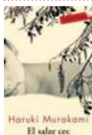
L'antologia de contes recollits a El salze cec i la dona adormida data del mateix any que La crònica de l'ocell que dona corda al món: el 1995. És el primer cop que Murakami va difuminar manifestament les fronteres entre la vigília i el somni.