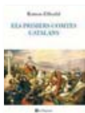
Els primers comtes catalans RAMON D'ABADAL La Magrana

La primera novel·la de David Safier (Bremen, 1966), Maleït karma , es va instal·lar a les llistes de llibres de ficció més venuts durant setmanes. Després de Jesús m'estima , Safier presenta ara la història de la Rosa, que decideix posar remei a la seva infelicitat deixant-se hipnotitzar i viatjant fins a l'any 1594. El cos que la Rosa tria per reencarnar-se és el del cavaller William Shakespeare. I no podrà tornar al present fins que no descobreixi l'amor de veritat.