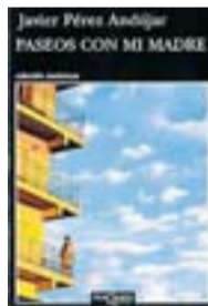
PASEOS CON MI MADRE JAVIER PÉREZ ANDÚJAR TUSQUETS 184 PÀG./15 €

I aquí el teniu, en aquest present, aconseguint quelcom que molt pocs saben fer avui en dia: emocionar-se i emocionar. ♦♦