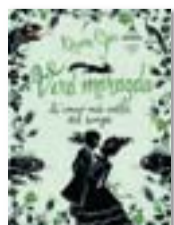
Verd maragda KERSTIN GIER La Galera