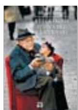
Reflexions d'un vell centenari MOISÈS BROGGI Edicions62

Moisès Broggi, cirurgià centenari, memorialista eficaç i home amb un fort compromís, que els últims anys ha anat augmentant de manera paral·lela al creixement de la seva notorietat pública, dóna a conèixer un recull de reflexions sobre el món actual. Broggi carrega contra el consumisme –diu que “està arruïnant el planeta”–, avisa dels perills que “la ciència sense ànima” avanci i aposta pel nacionalisme constructiu, vinculat a la cultura.