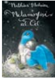
METAMORFOSIALCEL MATHIAS MALZIEU R.H.M. 149 PÀGS. 13,90 €

na sobre un dels sofàs de l'Hotel Hesperia Presidente de la Diagonal. Encara que es defensa perfectament en el camp de la música i que ja ha fet els seus primers tempteigs en el món del cinema, el negoci de la literatura rutlla fi com la seda. Després de les exitoses L'ombra allargada de l'amor i La mecànica del cor , que ja compten amb més de 350.000 lectors a França, Mondadori publica la seva tercera novel·la, Metamorfosi al cel , la història de Tom Hematoma