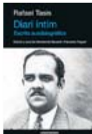
DIARI ÍNTIM RAFAEL TASIS ACONTRAVENT 428 PÀG./22,50 €

Diari íntim evidencia una personalitat literària magnífica i primordial, un escriptor que concep la literatura com un acte de servei a Catalunya, un home i ciutadà que es proclama irònicament com a extracatalanista i que morint a l'exili va dedicar la vida entera al servei de la llengua i del país petit. ♦♦