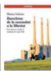
BARCELONA: DE LA NECES- SITAT A LA LLIBERTAT MARINA SUBIRATS L'AVENÇ, 440 PÀG./24 €

«Anar més de pressa a escriure una notícia o omplir més paraules no vol dir necessàriament estar més ben informat. Ara l'empresa i l'economia s'han menjat el periodisme i el ciutadà»