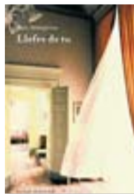
LLEFRE DE TU BIEL MESQUIDA CLUB EDITOR 210 PÀG./16,50 €

"Vinc d'una família on el que no anava prou ràpid era tard o d'hora exterminat (més d'hora que tard, com comprendreu, perquè a casa el que es podia fer avui no es deixava per demà". La dona veloç , d'Imma Monsó, ha guanyat el premi Ramon Llull 2012 amb una novel·la que retrata el nerviosisme dels nostres dies a través d'una protagonista hiperactiva.