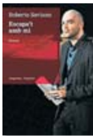
ESCAPA'T AMB MI ROBERTO SAVIANO ANAGRAMA- EMPÚRIES 152 PÀG./17 €

El parlamentari europeu Raül Romeva debuta com a novel·lista amb un thriller protagonitzat per una periodista de TV3 que, malgrat la crisi, aconsegueix tirar endavant un reportatge d'investigació. Darrere la notícia descobreix una trama alimentada per la immigració clandestina, l'espòli de les espècies marines i les fosques connexions entre poder econòmic i política.