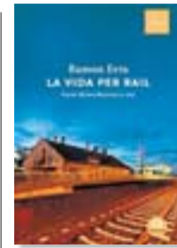
LA VIDA PER RAIL RAMONERRA PROA 198 PÀG./17,90 €

Fa més d'una dècada que Biel Mesquida no publicava cap novel·la. A Llefres de tu s'atreveix amb una narració motivada per l'absència de l'estimada, que desperta la creativitat del personatge narrador. "Hi ha moltes passejades, viatges i l'observació d'habitacions i indrets de la casa on viu", explica l'autor mallorquí, que ha treballat durant cinc anys en un dels seus millors llibres.