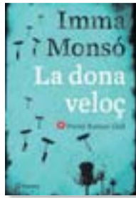
LADONA VELOÇ IMMA MONSÓ PLANETA 382 PÀG./20 €

«Espinàs escolta, però no pas com un confessor rere la reixa, obligat a la contenció i una paciència infinita. El seu tractat sobre la comunicació ens recorda una vegada i una altra que la comunicació és un diàleg»