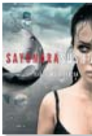
SAYONARA SUSHI RAÜL ROMEVA IRUEDA ROSADELS VENTS 224 PÀG./16,90 €

El parlamentari europeu Raül Romeva debuta com a novel·lista amb un thriller protagonitzat per una periodista de TV3 que, malgrat la crisi, aconsegueix tirar endavant un reportatge d'investigació. Darrere la notícia descobreix una trama alimentada per la immigració clandestina, l'espòli de les espècies marines i les fosques connexions entre poder econòmic i política.