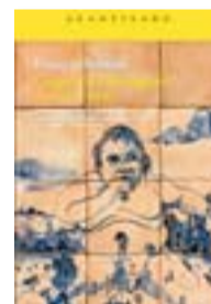
GARGANTÚAY PANTAGRUEL FRANÇOIS RABELAIS ACANTILADO 1520 PÀG./49 €

«Em sembla un títol fonamental de la literatura russa del segle XIX i calia que tornés a estar disponible en català. Si no llegim clàssics d'altres literatures en la nostra llengua serà molt difícil que creixi una novel·lística potent feta des d'aquí»