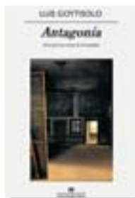
ANTAGONÍA LUIS GOYTISOLO ANAGRAMA 1120 PÀG./2490 €

«Mestre en l'art de dosificar la informació per crear inquietud i estranyesa, expert coneixedor de la condició humana, Doctorow és especialment magistral quan enfronta els seus personatges a uns dubtes seriosos i importants»