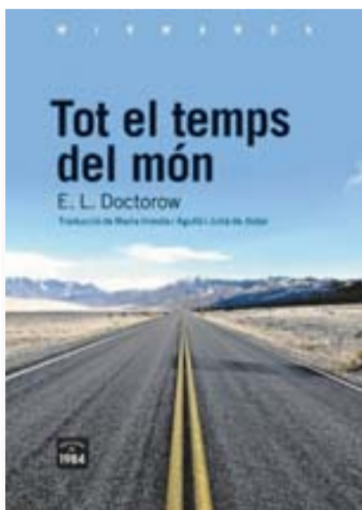
TOT EL TEMPS DEL MÓN EL DOCTOROW EDICIONS DE 1984 320 PÀG./19 €

El novaïorquès Edgar Lawrence Doctorow, autor de novel·les com La gran marxa , Ragtime , Homer i Langley i Billy Bathgate , és un dels imprescindibles de la literatura nord-americana contemporània, un clàssic viu amb una de les obres literàries més personals, heterogènies i coherents de la segona meitat del segle XX i principis del XXI. Tot el temps del món és un recull de relats sobre persones que "tenen algun tipus de conflicte amb el món imperant", segons explica el mateix Doctorow. El llibre aplega dotze contes publicats originàriament en diferents revistes. Doctorow en estat pur i en format curt.