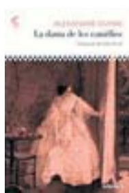
LADAMA DE LES CAMÈLIES ALEXANDRE DUMAS ADESIARA 272 PÀG./20 €

Amb motiu del segon centenari del naixement de l'escriptor anglès Charles Dickens (1812-1870), l'editorial A Contravent presenta una nova traducció, feta per Miquel Casacuberta, d'una de les seves novel·les més importants, Els papers pòstums del Club Pickwick , carregada d'humor i amistança. És un Dickens lluminós i vitalista.