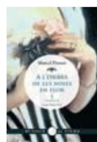
A L'OMBRA DE LES NOIES EN FLORI MARCEL PROUST VIENA 272 PÀG./19,50 €

Acantilado aplega en un sol volum les cinc novel·les de François Rabelais (1494-1553) protagonitzades pels gegants Gargantúa i Pantagruel. El prefaci de Guy Demerson i la traducció de Gabriel Hormaechea ajuden a contextualitzar aquest cim de l'humanisme farcit de sàtira, humor, ironia i enginy. Un clàssic universal de la literatura francesa.