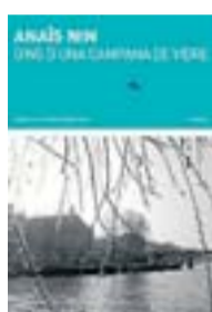
DINS D'UNA CAMPANA DE VIDRE ANAÏS NIN LABREU EDICIONS 114 PÀG./13,50 €

Anagrama celebra el número 500 de la col·lecció Narratives Hispàniques amb l'edició en un sol volum de la gran novel·la de Luis Goytisolo, que originàriament es va publicar en quatre parts. L' Antagonía unificada permet entendre per què Pere Gimferrer va dir que és "una de les obres més importants de l'actual narrativa en castellà".