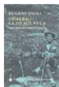
GUALBA, LA DE MIL VEUS EUGENI D'ORS QUADERNS CREMA 128 PÀG./16 €

Escrita en menys de tres mesos durant l'estiu del 1945, i inèdita fins al 2001, Alliberament és el testimoni de la fi del feixisme i l'entrada de les tropes soviètiques a Budapest. Márai (1900-1989) hi explica la història d'una jove que mira de sobreviure en un soterrani mentre als carrers s'hi desencadenen uns combats que decidiran el futur de la ciutat i del país.