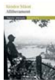
ALLIBERAMENT SÁNDORMÁRAI EMPÚRIES-SALAMANDRA 200 PÀG./18 €

Anaïs Nin (1903-1977) va escriure els relats d'aquest llibre entre el París dels anys 30 i Nova York. Són contes fruit de l'experiència vital de l'autora d' Una espia a la casa en què la fantasia, el somni i la realitat amaren una literatura hipnòtica carregada de simbolisme i de sensualitat. Dins una campana de vidre va ser el primer títol de Nin que va rebre l'atenció de la crítica internacional.