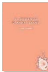
EL ROMANÇO D'ANNA TIRANT JOSEP PEDRALS LABREU EDICIONS 191 PÀG./15 €

El català s'afegeix a les més de vint llengües en què es pot llegir Maneres de mirar , un assaig pioner en l'anàlisi crítica de les imatges. L'origen del llibre es remunta a una sèrie de televisió emesa el 1972 per la BBC.