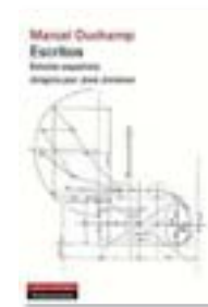
ESCRITOS MARCEL DUCHAMP GALAXIA GUTENBERG 560 PÀG./29 €

Aquestes màximes, amb què l'autor retrata amb lucidesa i escepticisme els comportaments humans com l'amistat o l'amor, són fruit de la seva participació assídua en diversos salons literaris parisencs, com és el cas del de Madeleine de Sablé o el de la marquesa de Sévigné.