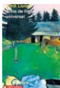
BRINS DE LITERATURA UNIVERSAL JORDI LLOVET GALAXIA GUTENBERG 440 PÀG./21 €

L'editorial Arola publica el primer dels sis volums que conformaran l'obra completa del poeta i assagista lleidatà, un dels pioners de l'art conceptual i un dels grans noms de la poesia experimental a Catalunya.