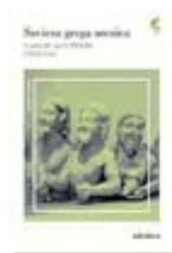
SAVIESA GREGA ARCAICA J. PÒRTULAS/S. GRAU ADEISARA 934 PÀG./36 €

La filosofia grega arcaica, representada pels fragments de gairebé una trentena de pensadors i concentrada en prop d'un miler de pàgines. Jaume Pòrtulas i Sergi Grau han dividit tota aquesta saviesa en seccions i l'han acompanyada de titolets per aplanar el camí als lectors fins a l'origen del pensament occidental.