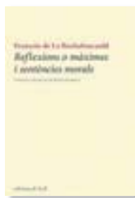
REFLEXIONS O MÀXIMES FRANÇOIS DE LA ROCHEFOUCAULD EDICIONS DE LA ELA GEMINADA 128 PÀG./14 €

Miquel de Palol torna a la poesia després de 12 anys i tanca amb aquest llibre la trilogia iniciada amb El Sol i la Mort (1996) i Nocturns (2002). Aire amb cel de fons conté des de poemes de caire humorístic i amorós fins a reflexions sobre el pas del temps i sobre la natura.