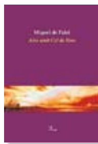
AIRE AMB CEL DE FONTS MIQUEL DE PALOL PROA 128 PÀG./16 €

Una novel·la versificada “amb el ritme d'una tragèdia grega i un virtuosisme barroca” que relata les aventures de l'Anna Tirant i les converses que Josep Pedrals manté amb el seu alter ego literari Quim Porta, que va fer la seva aparició al poemari El furgatori .