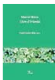
LLUM D'IRLANDA MARCEL·LÍ RIERA PROA 96 PÀG./16 €

«Hi ha una deliberada intenció que els lectors puguin passar d'un fragment a un altre, perquè se'ls puguin fer seus»