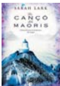
SARAH LARK LACANÇÓ DELS MAORÍS EIDICIONES B 704 PÀG. / 21,50 €

Federico Moccia és el culpable que a la majoria de capitals europees hi hagi cadenats –en senyal d'amor etern– lligats a ponts i tanques. Després de deixar rendits els adolescents italians amb novel·les com Tres metres sobre el cel i Perdona si et dic amor , l'italià –que signarà llibres per Sant Jordi a Barcelona– escriu aquí una nova història d'amor però per a un públic adult.