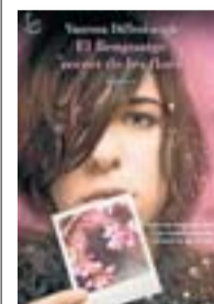
EL LLENGUATGE SECRET DE LES FLORS V. DIFFENBAUGH EDICIONS 32 416 PÀG. / 18,50 €

«La descripció del sexe és tècnica i postural. És un conte de rutina: el sexe també ho havia de ser. Tard o d'hora, tothom acaba fent sexe rutinari. El repertori és limitat... D'altra banda, costa trobar escriptors que narrin bé el sexe»