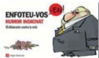
ENFOTEU-VOS-EN! DIVERSOS AUTORS ANGLE EDITORIAL 144 PÀG. / 12,80 €

Les retallades, la banca, l'habitatge i els polítics, entre altres temes d'actualitat, són el blanc de la sàtira de 45 dibuixants, entre els quals n'hi ha alguns dels més importants del país, com ara Kap, Toni Batllori, Miquel Ferreres, Andreu Buenafuente i Manel Fontdevila. Humor indignant.