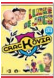
CRACKÒVIA. EL LLIBRE DE JOCS DIVERSOS AUTORS COLUMNA TVC 120 PÀG. / 18,95 €