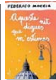
AQUESTA NIT DIGUES QUE M'ESTIMES FEDERICO MOCCIA DETALLS 464 PÀG. / 18,90 €

El nou recull de contes de Francesc Serés ( La força de la gravetat , Contes russos ) mostra les diverses cares i edats de l'amor. Fascinació infantil, excitació adolescent, compromís, rutina, angúnia, mascotes, Viagra i algun amant: Serés condensat, però en estat pur. L'encàrrec dels contes va venir de la revista Time Out . En el projecte hi havia dos constreïments molt marcats: la periodicitat (havia de sortir un conte cada setmana) i l'extensió (que havia de ser de 5.000 espais). No hi ha sociologia, però "sí que conté un punt de voluntat descriptiva, de narrar les parelles que han anat passant per la teva vida, les pròpies i les dels altres".