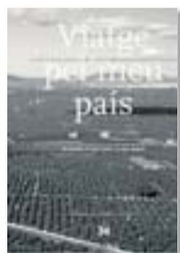
VIATGE PEL MEU PAÍS JOAN GARÍ (TEXT); J.A. VICENT (FOTOS) EDICIONS 314 384 PÀG./48 €