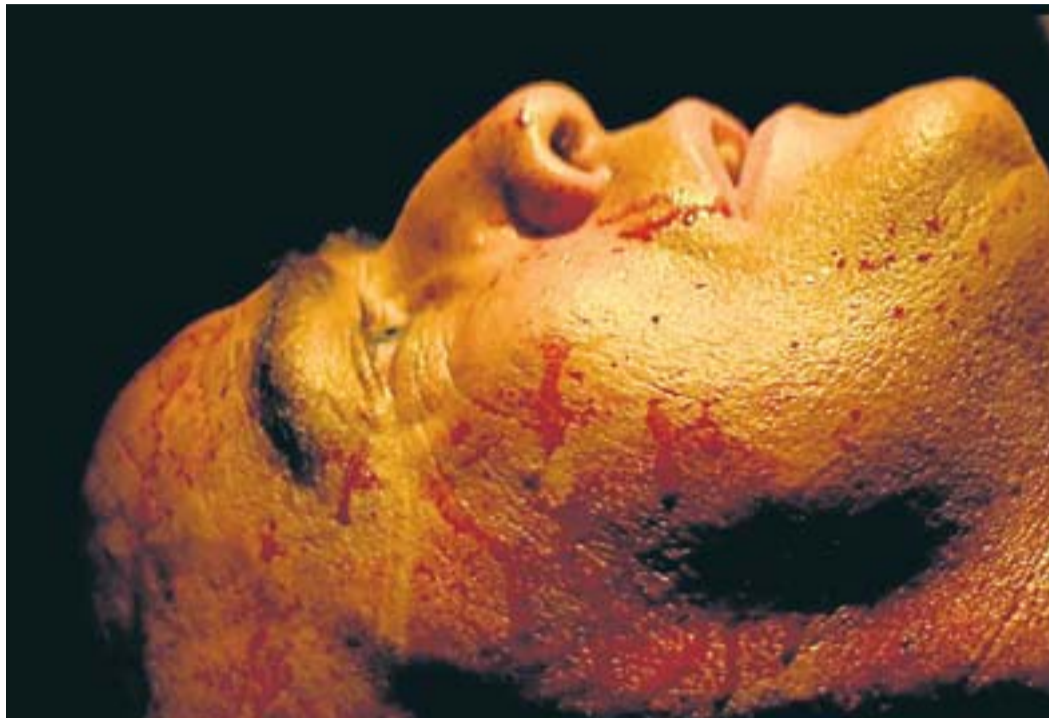
"UNA AVANÇADA AL PROGRÉS" RECORDA "EL COR DE LES TENEBRES", DE LA QUAL F.F. COPPOLA VA FER UNA ADAPTACIÓ LLIURE A "APOCALYPSE NOW"