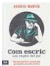
Com escric ANDREU MARTÍN Ara Llibres

John Banville segueix desdoblant-se en dos: el lirisme de les novel·les que signa amb el seu nom contrasta amb la grapa i l'humor negre de la sèrie signada amb el nom de Benjamin Black. Mort a l'estiu és un nou lliurament protagonitzat per l'inspector Hackett i el seu company Quirke. El punt de partida és la mort d'un magnat de la comunicació. Els secrets i les foscúries de l'empresari aniran apareixent a mesura que la investigació avanci.