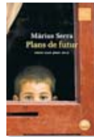
PLANS DE FUTUR MÀRIUS SERRA PROA 254 PÀG. / 21,50 €