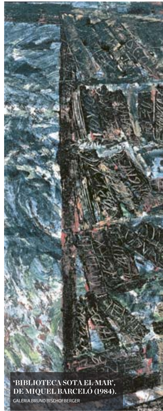
'BIBLIOTECA SOTA EL MAR', DE MIQUEL BARCELÓ (1984).

L'editorial Moll acaba de publicar 'Els caus secrets', amb narracions de 61 autors de Catalunya, les illes Balears i el País Valencià nascuts a partir del 1972. El volum, de gairebé 600 pàgines, és una mostra ambiciosa i d'una gran varietat estilística, que barreja autors consagrats i veus quasi inèdites