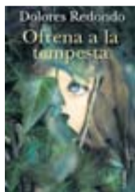
OFRENA A LA TEMPESTA DOLORES REDONDO COLUMNA / DESTINO TRADUCCIÓ DE NÚRIA PARÉSSELLARÉS 592 PÀG. / 18,50 € (LLIBRE ELECTRÒNIC, 9,99)

● Recuperació de 'La família Golovliov', una de les grans sàtires russes ● Belén Gopegui publica nova novel·la