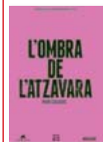
L'OMBRA DE L'ATZAVARA PERE CALDERS EDICIONS 62 288 PÀG. / 9,95 € (AQUEST DIUMENGE, AMBLARA)

El desenllaç de la Guerra Civil obligaria a ajornar les trajectòries de tots quatre autors. Espriu gairebé va abandonar la prosa, fins que va reneixer com a poeta amb Cementiri de Sinera (1946). Francesc Trabal es va instal·lar a Xile i no va publicar res fins a Temperatura (1947). Rodoreda va viure a París i a Ginebra, des d'on va escriure Vint-i-dos contes (1958) i La planta del Diamant (1962). I Calders, durant l'estada a Mèxic (1939-1962) va treballar alguns dels seus grans llibres, des de Cròniques de la veritat oculta (1955) fins a L'ombra de l'atzavara , que va publicar a Selecta al 1964, quan ja havia tornat a Barcelona. ♦