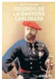
RECORDS DE LA DARRERA CARLINADA MARIAN VAYREDA L'AVENÇ 136 PÀG. / 13 €

És veritat que Vayreda no explota tot el potencial narratiu d'algunes escenes, que en ocasions el relat és estàtic i li costa ser trepidant i que a vegades automatitza el recurs del contrast entre la innocència del jove i el desencany de l'adult. Però l'ús viu que s'hi fa del llenguatge, la perspicàcia d'home desencantat del narrador i el colorisme autèntic amb què hi bateja el passat fan de Records de la darrera carlinada un llibre tan amè com interessant. ♦