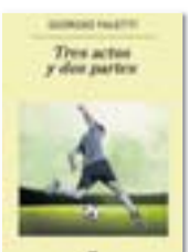
Tres actos y dos partes GIORGIO FALETTI Anagrama

Silvano Masoero és un boxejador retirat de 60 anys que és assistent d'un equip de Segona Divisió, en què juga el seu fill Roberto. Durant l'últim partit de la temporada, el noi serà temptat per les apostes il·legals i haurà de decidir si opta per guanyar una pessigada de diners fàcils o no. Faletti és un dels últims supervenides italians: dels seus dos llibres anteriors, Yo mato i Apunts d'un venedor de dones , n'ha venut 15 milions d'exemplars a tot el món.