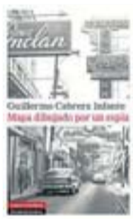
MAPA DIBUJADO POR UN ESPÍA GUILLERMO CABRERA INFANTE GALAXIA GUTENBERG 396 PÀG. / 21 €

Desfilen entre les pàgines d'aquest llibre colpidor una colla de personatges reals: polítics, artistes i escriptors. Alejo Carpentier, José Lezama Lima, Nicolás Guillén, Calvert Casey, Virgilio Piñera, Fidel Castro, Che Guevara, Tomás Gutiérrez Alea... gent que acaba reflectint la misèria física i moral que vivia aquella Cuba dels anys seixanta. Mapa dibujado por un espía pinta el desànim aclaparador dels seus habitants, l'irrespirable ambient per falta de llibertat i la por constant a ser denunciat per qualsevol com a contrarevolucionari. Pura autenticitat històrica i valentia, just per constatar que el mal a Cuba sembla perdurable. De fet, aquest 2013 els Castro van fer tancar als penals més de 6.400 presos polítics.