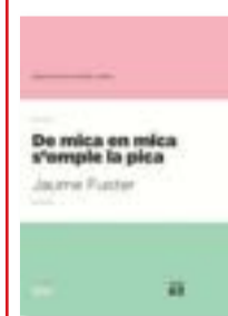
DEMICA EN MICA S'OMPLE LA PICA JAUME FUSTER EDICIONS 62 192 PÀG. / 9,95 € (AQUEST DIUMENGE, AMBLARA)

Fuster va debutar el 1971 amb Abans del foc , i són seves novel·les com La corona valenciana (1982), L'illa de les tres taronges (1983) i La guàrdia del rei (1995), a més de col·laborar en els diversos reculls del col·lectiu Ofèlia Dracs . Malauradament, l'autor barceloní va morir prematurament el 1998, amb només 53 anys.