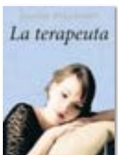
La terapeuta GASPAR HERNÁNDEZ Columna/Planeta

L’Hèctor Amat és un actor teatral d’uns 40 anys que, sortint d’una representació de Tendra és la nit , veu com assassinen una dona al pàrquing on va a buscar el cotxe per tornar cap a casa. Tot i que no resulta ferit físicament, l’actor comença a patir ansietat i és vigilat de prop per la terapeuta Eugènia Llorca. Aquesta és la premissa argumental de la segona novel·la del periodista Gaspar Hernández, que amb El silenci va guanyar el premi Josep Pla el 2009.