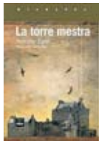
LATORRE MESTRA JENNIFEREGAN EDICIONS DE 1984/ MINÚSCULA TRAD. CARLES MIRÓ 314 PÀG./20€

És així com Egan lliga tres històries dins de la novel·la, en què els gèneres literaris també es barregen. A La torre mestra hi conviuen un conte de fantasmes, el relat de ciència-ficció i la crònica social. La relació dels dos cosins, dins de l’espai asfixiant i laberíntic de la torre, és l’argument que ocupa més pàgines en la novel·la. Egan, pel broc gros i amb l’imaginari medieval com a referent, relata la supervivència del Danny enmig del grup d’adeptes a la causa del Howie que restaura l’antic castell. A mig camí entre una pel·lícula d’Indiana Jones, l’estètica de Joc de trons i el desconcert oníric d’un film a l’estil d’ Inception , La torre mestra és un pastitx pertorbador. La tradició europea es representa amb el personatge de la baronessa Ausblinker, propietària de la torre. Qui ha de ser la figura amenaçant exhibeix el punt estrofolari i inofensiu dels quadres enormes de comtes i duquesses a qui se’ls mouen els ulls. Entre el somni i la realitat, la bogeria amenaça tots els personatges, que d’una manera o una altra han perdut la llibertat. Com diu la Holly, la professora del taller literari, el que pretén amb les classes és “crear una porta” dins de la ment dels alumnes perquè puguin escapar-se. Que comprin els drets de La torre mestra i en facin una pel·lícula ben americana. Serà un èxit. ♦♦