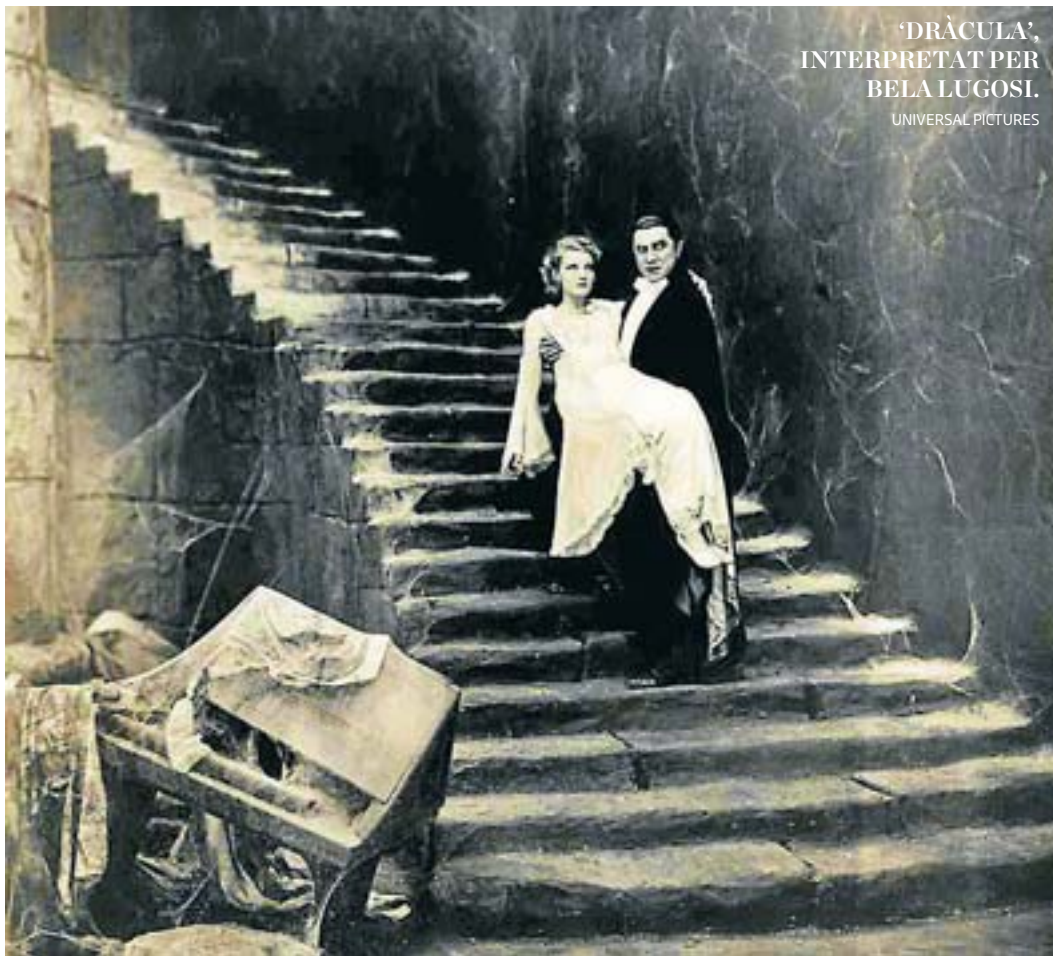
‘DRÀCULA’, INTERPRETAT PER BELA LUGOSI. UNIVERSAL PICTURES