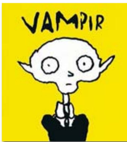
VAMPIR JOANN SFAR FULGENCIO PIMENTEL TRAD. RUBÉN LARDÍN 216 PÀG./25€

El Fernand és un vampir lituà que es defineix com a depressiu. Només mossega amb un ullal perquè la víctima pensi que l'ha mossegat un mosquit. Té aficions antiquades, però és capaç d'anar a una rave o a una discoteca si el convenç alguna noia. Vol viure tranquil, però busca desesperadament l'amor després que l'aban-