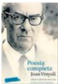
POESIA COMPLETA JOAN VINYOLI LABUTXACA PRÒLEG D'ENRIC CASASSES 500 PÀG./14,90 €

fascina Margarit i que escriu poemes com Una làpida, A les tres copes dic això i De set a nou , tots de Realitats , o Queralbs, Retrat de família i Happyfew , de Tot és ara i res (1970), que Margarit relaciona amb l'amant del poeta. "Ho explico al pròleg perquè no és cap secret -diu Joan Margarit-. I passa el mateix amb els problemes amb l'alcohol. Si a ell no li va importar que una i altra cosa se sabessin, perquè ho hauria d'amagar?" L'antologia inclou una representació extensa de llibres com Encara les paraules (1973) i Ara que és tard (1975). La tria de Vent d'aram (1976), El griu (1978) i Cercles (1979) és una mica menys generosa. "El millor Vinyoli és el que va de Tot és ara i res , publicat el 1970, fins a Cercles . La dècada dels 70 és el seu gran moment.