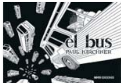
ELBUS PAUL KIRCHNER NINTH EDICIONES 96 PÀG./15,00 €

ra. Són el referent quotidià a partir del qual Kirchner desplega un món estrany i meravellós que subverteix les expectatives del lector manipulant les lleis de la física, jugant amb el llenguatge narratiu