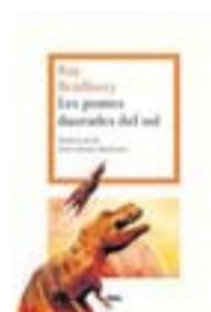
LES POMES DAURADES DEL SOL RAY BRADBURY RBA-LA MAGRANA TRAD. DE LLUÍS-ANTON BAULENAS 448 PÀG./21 €

Això no vol dir, de tota manera, que el tema de l'espai sigui explorat amb una mirada unívocament mitificadora. Al contrari, Bradbury ens el mostra des de tots els angles: el de l'aventura i la glòria -"El coet feia