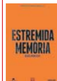
ESTREMIDA MEMÒRIA JESÚS MONCADA EDICIONS 62 312 PÀGINES / AQUEST CAP DE SETMANA, ELS DOS LLIBRES PER 9,95 EUROS