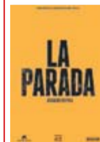
LA PARADA JOAQUIM RUYRA EDICIONS 62 206 PÀGINES