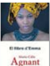
El llibre d'Emma MARIE-CÉLIE AGNANT Edicions 3i4

“L'Emma em projecta dins d'aquest oceà opac de la identitat negada. Amb ella he emprès un viatge llarg i dolorós dins de la bodega d'un vaixell, dins de l'infern de les plantacions, m'ofegue; esclava marrona...”. Una mare, acusada d'assassinar la seva filla, és internada en un psiquiàtric, on inicia un procés que farà sortir a la llum les complexitats de la raça negra, causades pels llargs anys d'esclavitud i, en aquest cas, per la seva subjugació al poder colonial.