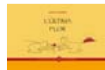
L'última flor JAMES THURBER Viena

Probablement mai s'arribarà a una formulació definitiva sobre què és l'art, però això no priva de l'experiència que genera. Ara la llibertat és el fonament, sense dogmes ni canons establerts, i com la resta de valors de la nostra època, es regeix pels canvis constants. Tot i així, l'art contemporani també està marcat per moments, obres i moviments clau que han dibuixat una història darrere la pintura, l'arquitectura, la fotografia o el cinema.