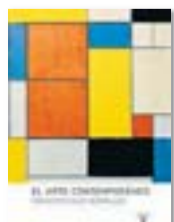
El arte contemporáneo F. CALVO SERRALLER Taurus

“L'Emma em projecta dins d'aquest oceà opac de la identitat negada. Amb ella he emprès un viatge llarg i dolorós dins de la bodega d'un vaixell, dins de l'infern de les plantacions, m'ofegue; esclava marrona...”. Una mare, acusada d'assassinar la seva filla, és internada en un psiquiàtric, on inicia un procés que farà sortir a la llum les complexitats de la raça negra, causades pels llargs anys d'esclavitud i, en aquest cas, per la seva subjugació al poder colonial.