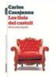
LES LLEIS DEL CASTELL CARLES CASAJUANA PÒRTIC / PENÍNSULA 200 PÀG. / 16,90 €

Casajuana desenvolupa una llarga metàfora del poder com a casino on els protagonistes es juguen les fitxes (la permanència), mentre es van distanciant de la realitat i de la mesura del talent. Són alhora, diu l'autor, el jugador i l'aposta. El llibre és ple de frases que són autèntics aforismes. El poder, insisteix, sempre és en un altre lloc, és impossible d'atrapar, circula. A les altures, marxa i fa perdre peu; als nivells inferiors, és pura angoixa perquè tot el que no sigui avançar és recular. I al davant hi té els ciutadans que observen, critiquen, jutgen o esperen. Casajuana va disseccionant les variants que actuen en aquest joc pervers d'arribar al poder amb ganes de fer coses i d'establir-s'hi només amb ganes de conservar el que es té: l'adulació del voltant, la pompa dels rituals, el reconeixement. El poder dóna sentit a la vida dels poderosos. Però també un dictamen per escoltar: “Només es pot governar un poble oferint-li un futur”. Ho va dir Napoleó i és la clau de tot plegat.