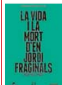
LA VIDA I LA MORT D'EN JORDI FRIGINALS JOSEP POUS I PAGÈS EDICIONS 62 320 PÀG. / 9,95 € (DIUMENGE, AMBLARA)