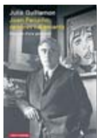
JOAN PERUCHO, CENDRES I DIAMANTS JULIÀ GUILLAMON GALAXIA GUTENBERG 734 PÀG. / 39 €