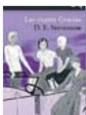
Las cuatro Gracias D.E. STEVENSON Alba Editorial

Quatre caràcters molt diferents que comparteixen una intuïció i un sentit de l'humor especials, la Liz, la Sal, la Tilly i l'Addie, les quatre filles del senyor Grace, hauran d'utilitzar aquestes qualitats per afrontar les novetats de la Segona Guerra Mundial a la seva pacífica vida anglesa.