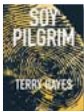
'Soy Pilgrim' TERRY HAYES Salamandra Trad. C. Martín

En una plaça de l'Àrabia Saudita, un home és executat sota un sol de justícia i un noi de catorze anys –el seu fill– ho observa. Una dona apareix morta en un hotel de Manhattan. Un expert en biotecnologia és trobat sense vida en un abocador. Soy Pilgrim connecta tots els crims.