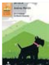
'Brisca' ANDREU MARTÍN Editorial Cruïlla