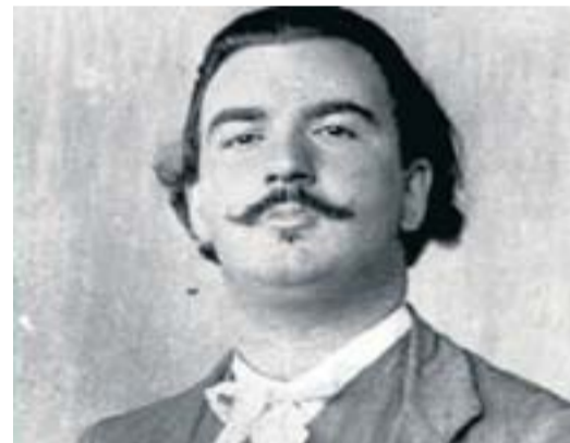
FUNDACIÓ FRANCESC PUJOLS

El llibre s’obre amb aquestes paraules proemials del mateix Pujols, transcrits per Pla: “Quan, després de molt de temps d’estudiar i de meditar enmig de l’existència coneguda, vaig trobar les línies generals que em permeten d’establir el sistema, no sols vaig sentir la impressió de seguretat que dona la ciència, sinó que vaig tenir una gran alegria. Tenir sistema era per mi com tenir cotxe”. La metàfora no és gaire afortunada, si es mira el gruix de la història de la filosofia: ni Plató ni Aristòtil van tenir res semblant a un cotxe, però el segon té un bon sistema filosòfic; ni Kant –per anar a l’altre cap dels grans sistemes filosòfics– anava amb cotxe (de cavalls) quan ja n’hi havia.