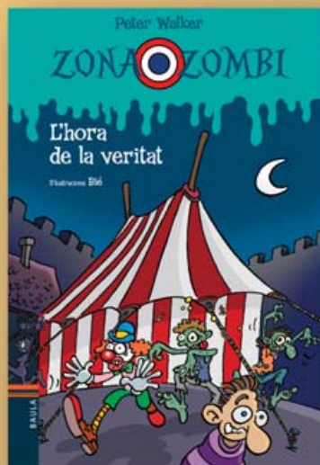
L'hora de la veritat Text: Peter Walker Il·lustracions: Bié