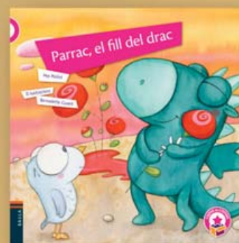
Parrac, el fill del drac Text: Pep Molist Il·lustracions: Bernadette Cuxart