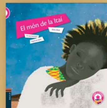
El món de la Itai Text: Asha Miró Il·lustracions: Patricia Geis