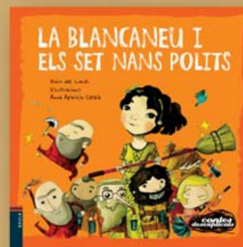
La Blancaneu i els set nans polits Text: Vivim del Cuentu Il·lustracions: Anna Aparicio Catalá