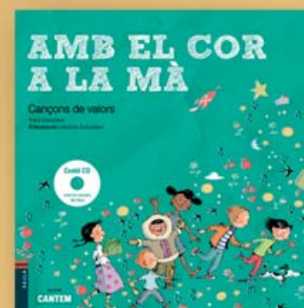
Amb el cor a la mà Text: Toni Giménez Il·lustracions: Cristina Losantos