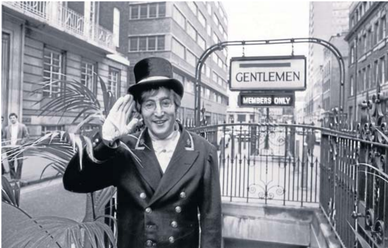
RON CASE / KEYSTONE