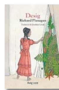
DESIG RICHARD FLANAGAN RAIG VERD TRADUCCIÓ DE JOSEFINA CABALL 256 PÁG. / 19,50 €

guir-los, finalment, l'havien condemnat a la burla i a l'escarni”. Amb aquests vímets l'autor teixeix un relat de costures clàssiques que barreja tres escenaris: el Londres de l'època de glòria de Charles Dickens (la part central del segle XIX), una expedició polar a la recerca de la llegendària ruta del pas del nord-oest a través del gel de l'àrtic i una colònia penal a Tasmània, a l'altra punta de la Terra.