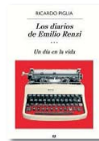
LOS DIARIOS DE EMILIO RENZI. UN DÍA EN LA VIDA RICARDO PIGLIA ANAGRAMA 296 PÁG. / 21,90 €

Finalment, Piglia se'n va a fer de professor a Boston i el tema de les classes, que en definitiva són lectures aprofundides, ocupa molt d'espai. És més coneixement destil·lat. I aquí ens arriba una pirueta en forma de segona part del volum: una narració que posa en pràctica la teoria, en què Piglia és protagonista i ens permet observar-lo en l'acció. Hi ha un narrador, podem presumir que estem davant d'una fabulació.