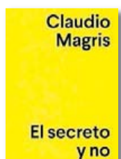
El secreto y no CLAUDIO MAGRIS Anagrama

Anagrama inaugura Anova col·lecció d'assaig amb una reflexió de Claudio Magris sobre totes les cares dels secrets. A través d'autors com Norman Manea, Javier Marías i Isaac Bashevis Singer, l'escriptor indaga en el secret com a arma de poder, instrument religiós, element íntim i mecanisme literari.