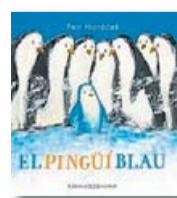
El pingüi blau PETR HORÁČEK Joventut

Ningú vol ser amic del pingüi blau perquè el seu color no s'assembla al dels altres. Canta i viu en solitud fins que una petita pingüi se li acosta per sentir les seves cançons. Amb il·lustracions de gran format, Horáček explica una favela entranyable sobre la diferència, el sentiment de pertinença i l'amistat.