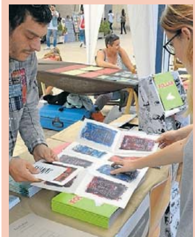
UNA IMATGE DE LA FIRA DE BESALÚ DEL 2016.