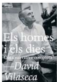
ELS HOMES I ELS DIES. OBRA NARRATIVA COMPLETA DAVID VILASECA L'ALTRA EDITORIAL 752 PÀG./25 €

Com el narrador de Moby Dick , David Vilaseca (Barcelona, 1964 - Londres, 2010) es presenta al lector al pròleg de la seva primera novel·la, L'aprenentatge de la soledat . Però ell va més lluny: és autor i personatge, ja que converteix els seus dietaris en ficció i, com la gran balena blanca, per l'ambició literària i la radicalitat amb què exposa tots els aspectes de la seva vida al llarg de més de 20 anys, des del 1987 fins al 2009, apareix com una figura insòlita en el panorama de la literatura catalana.