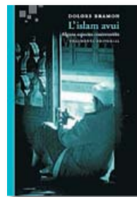
L'ISLAM AVUI DOLORS BRAMON FRAGMENTA 256 PÀG. / 18 €

Aquest desconeixement filològic, històric i polític també afecta el mateix món islàmic, que es debat entre interpretacions contradictòries: "A base d'estimar desmesuradament la lletra", s'ha ignorat sovint "l'esperit de l'Alcorà". Això ha permès deformar el sentit original de termes com jihad o xaria , crear mites com el paradís de les hurís o gene-