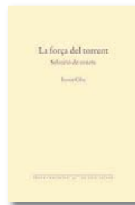
LA FORÇA DEL TORRENT BERNAT CIFRE EL GALL EDITOR 90 PÀG. / 12 €

sa, / a trossos o bocins, jamai ben clo-sa. / Cap música de mots, d'accents cap ball". Una defensa estètica que esdevé ètica: la llengua, se l'ha de tractar bé. I qui no tingui talent, traça i ganes de picar pedra, que ho deixi córrer, o almenys que no castigui el lector amb els seus versos . Ell fa befa del mal anomenat "vers lliure" quan no és més que "prosa trinxada", que en deia Auden. Els poemes juganers són impagables, com el Sonet col·loquial , on detecta el decasíl·lab que diu inconscientment la veïna botiguera: "M'han fotut un saquet de patató", i munta, a partir de l'anècdota, un sonet impecable. Sampol en diu "oïda absoluta mètrica", que és el mateix que li passa a Carles Morell. El cicle de sonets dedicats a la memòria de la mare són commovedors. ♦♦