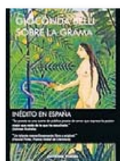
'Sobre la grama' GIOCONDA BELLI Navona

Coincidint amb la participació a l'últim Festival Internacional de Poesia de Barcelona, Gioconda Belli torna a les llibreries amb Sobre la grama , on escriu una sèrie de poemes centrats en el fet de ser una dona, on els retrets són puntuals: Belli admet que la seva poesia "neix de la felicitat".