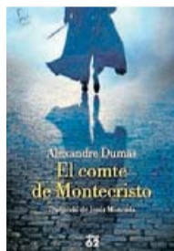
EL COMTE DE MONTECRISTO ALEXANDRE DUMAS EDICIONS 62 TRADUCCIÓ DE JESÚS MONCADA 1.156 PÀG. / 27,90 €

Igual que al relat de l'arxivista francès, Dantès es veu embolicat en una trama en què se l'acusa de ser bonapartista (en aquella època Napoleó estava exiliat a l'illa d'Elba), una acusació que li enganxen com una pegellida i que el porta a ser empresonat al castell d'If, on coneix un altre presoner, l'abat Faria, que acaba donant a Dantès l'educació que no va tenir mai (com tampoc Dumas), a més de confessar-li l'existència i ubicació d'un tresor a l'illa de Montecristo. Seria absurd seguir desvetllant l'argument, tant per al que ja hallegit la novel·la com per al que no l'ha llegida mai, però val a dir que Dantès és un dels grans personatges de la literatura universal, i que, contràriament al que passa a Els tres mosqueters , porta gairebé sol el pes de la narració. Des del principi planeja una revenja que ha de ser absoluta, sense esclatxes, i per això es converteix en una mena de superheroi sense poders: algú immensament ric, totpoderós, fins i tot (i això sí que és un detall modern) capaç de manipular el mercat dels bons amb l'única finalitat d'arruïnar un dels seus enemics. Dantès és un personatge tan polièdric que va assumint diversos noms a mesura que avança l'acció i és capaç de provocar-nos llàstima, ràbia, admiració, repugnància. Naturalment, acabarà descobrint que només amb l'odi no pot recuperar el seu antic amor, però aleshores ja haurà deixat un llarg requitzell de cadàvers. ♦♦