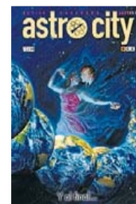
ASTRO CITY. Y AL FINAL... KURT BUSIEK I BRENT ANDERSON ECC COMIC 160 PÀG. / 16,95 €

superheroic parant atenció a les històries que la dinàmica industrial del còmic acostuma a obviar: la decadència física dels superherois sense poders, les seves dinàmiques de parella, les persones amb poders que no volen ser superherois... Busiek també introdueix –amb esforç– una trama transversal que trenca la quarta paret i recupera personatges dels inicis com el supermalvat reconvertit en detectiu privat Jack Acero, la comptable que treballa al barri sobrenatural d'Astro City o l'home que enyora l'esposa que va tenir en una realitat esborrada per un esdeveniment còsmic a l'estil de les Crisis infinites . Una visió més humana del gènere, amb grans dosis d'enginy i emotivitat que revelen un Busiek encara inspirat. ♦♦