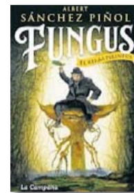
FUNGUS. EL REI DELS PIRINEUS ALBERT SÁNCHEZ PIÑOL LA CAMPANA 360 PÀG. / 20,90 €

Però la novel·la té dos problemes estructurals, que llasten el conjunt. El primer problema és que el protagonista, anomenat Ric-Ric, un presumpte anarquista de Barcelona