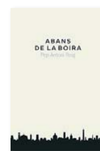
ABANS DE LA BOIRA PEP ANTONI ROIG ANDANA 120 PÀG. / 16 €

Abans de la boira es clou amb una cita d'Enrique Vila-Matas que lloa “els obstinats que mantenen la fe en la imaginació durant més temps que altres”. Precisament aquest esperit rebel i utòpic –“Siguem realistes, demanem l'impossible” mig segle més tard– és el que encén la novel·la i la transforma en alguna cosa més que la clàssica pirrotècnia del debutant que ha de de-