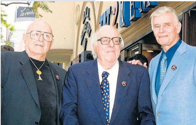
Els actors Rod Steiger i Charlton Heston envoltant l'escriptor i guionista Ray Bradbury.

Bradbury, que era un home d'una amplíssima cultura i un gran lector de poesia, teixeix més un homenatge que una obra crítica o satírica, i el seu encert consisteix en el dinamisme que imprimeix al relat, el paral·lelisme que traça entre la vida quotidiana i la vida desmesurada que era el món de Hollywood, on ens fa passar una bona estona esquitxada d'una prosa lúcida i primorosa. ♦♦