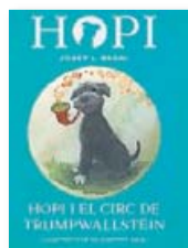
Hopi i el circ de... J.L. BADAL La Galera

Londres és l'escenari d'una nova aventura del Hopi, un cadell de schnauzer entranyable i valent. En aquesta ocasió, el protagonista vol ajudar una nena molt tímida i els animals d'un circ ben peculiar. Amb il·lustracions de Zuzanna Celej, la història del Hopi és un cant a la llibertat dels animals.